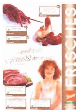
Folder für die Festtage

Fisch und Fleisch in der deutschen Gastronomie-Landschaft: Im Rahmen von so genannten „Surf & Turf“-Menüs bilden Fisch & Seafood mit hochwertigen Fleisch-Spezialitäten eine außergewöhnliche kulinarische Symbiose. mb